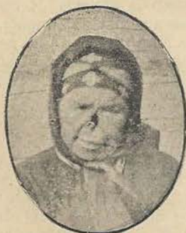
Fig. 3. Maljuna virino el la vilaĝo Jawina, kuracita per incensado cinabra. Post elkuraco ŝi sentis sin sana kaj havis kelkajn infanojn.

Kaj nun kelkaj vortoj pri la hospitaloj. La sinjoroj kuracistoj, alveninte Kamčatka'n ekokupis sin per perforta transportado de malsanuloj en la hospitalojn kaj se ili ren- kontis en vilaĝo iun malsanulon aŭ malsanu- linon, ili ordonis veturigi tiujn ĉi sen ia ajn konsidero hospitalon, kelkfoje je centoj da verstoj, kio daŭris ĉe neĝolovadoj kelkajn semajnojn. La vojaĝo fariĝadis plejparte vin- tre, kelkfoje sur plej malfacilaj vojoj kaj ĉe plej granda malvarme, krom tio oni forpre- nadis iaforte la unikan mastrinon el la kabano. Tiu ĉi perforto tiom timigis la loĝantaron, ke ĉe sciigo pri alveno de kuracisto oni kaŝis la malsanulojn aŭ ilin forveturigis post la vila- ĝon ĝis la tempo, kiam la kuracisto estis traveturinta la vilaĝon.