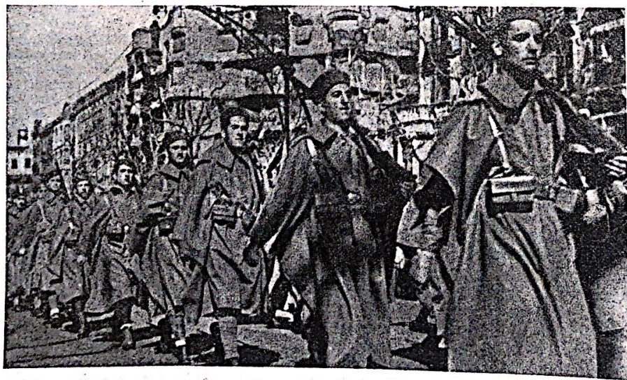
La improvisitaj armitaj grupoj da milicanoj, en la unuaj momentoj de la ribelo, transformiĝis jam en normalaj regimentoj de kuraĝaj soldatoj. Jen parado de la nova Popola Armeo

Ĉiu agas laŭ sia naturo. La faŝistoj agas faŝiste. La antifaŝistoj ne povus agi sammaniere ĉar iliaj principoj estas malsamaj. Malsamaj, sekve, estas iliaj procedoj en milito k dum rekonstruado en la paco.