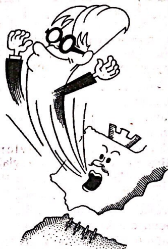
K-do. Alvarez del Vayo aŭ la voĉo de Hispanio

DUM POPOLO BATALAS POR EFIKA DEFENDO DE SIA GRUNDO, ESTAS BONA KOMPLEMENTO, KANCELARIA PROTESTO, PRO ITALA INVADO, POR SENMASKIGO DE FRIPONOJ