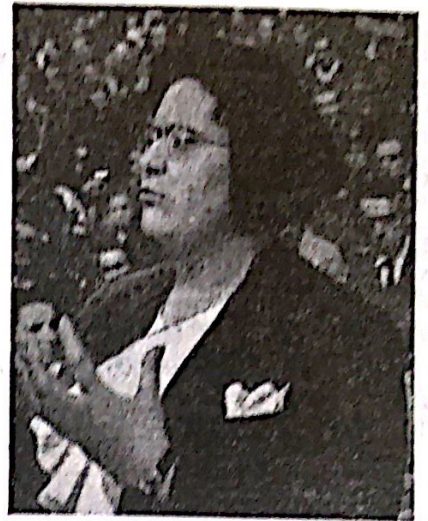
Frederika Montseny, ministro de Saneco k Socia Interhelpo; ŝi apartenas al sindikata organizo C. N. T. k estas la unua virino, en Hispanio, kiu okupas postenon de ministro.

Kunigi ĉies fortojn, jen estas la nuna devo de ĉiu konscia antifaŝisto—klara unuiga vorto—laŭ postulo de la cirkonstancoj Kontraŭstari, per teoriaj subtilaĵoj, la plenumon de tiu urĝa bezono estus danĝera fanatikemo aŭ balainda mallerteco, ĉiam malfacila baro por plej decida ŝtupo en la supreniranta marŝo al vivo sen sufero. La propra sperto, por ni, estas instruilo