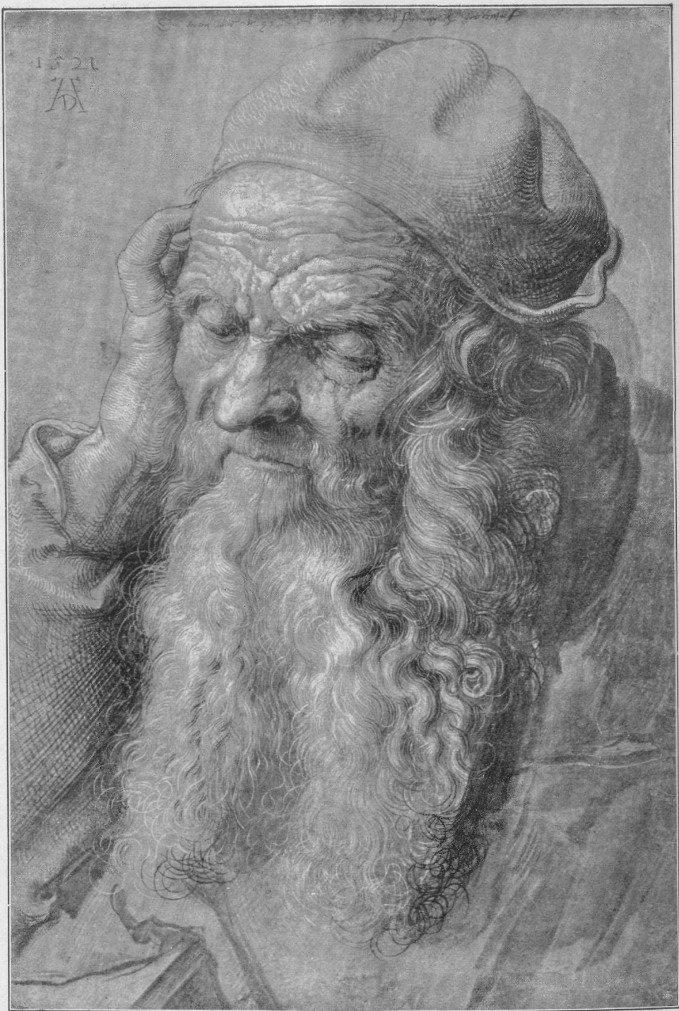
La maljuna viro de Antverpeno (mandeseĝaĵo) 1521. (Vieno.)