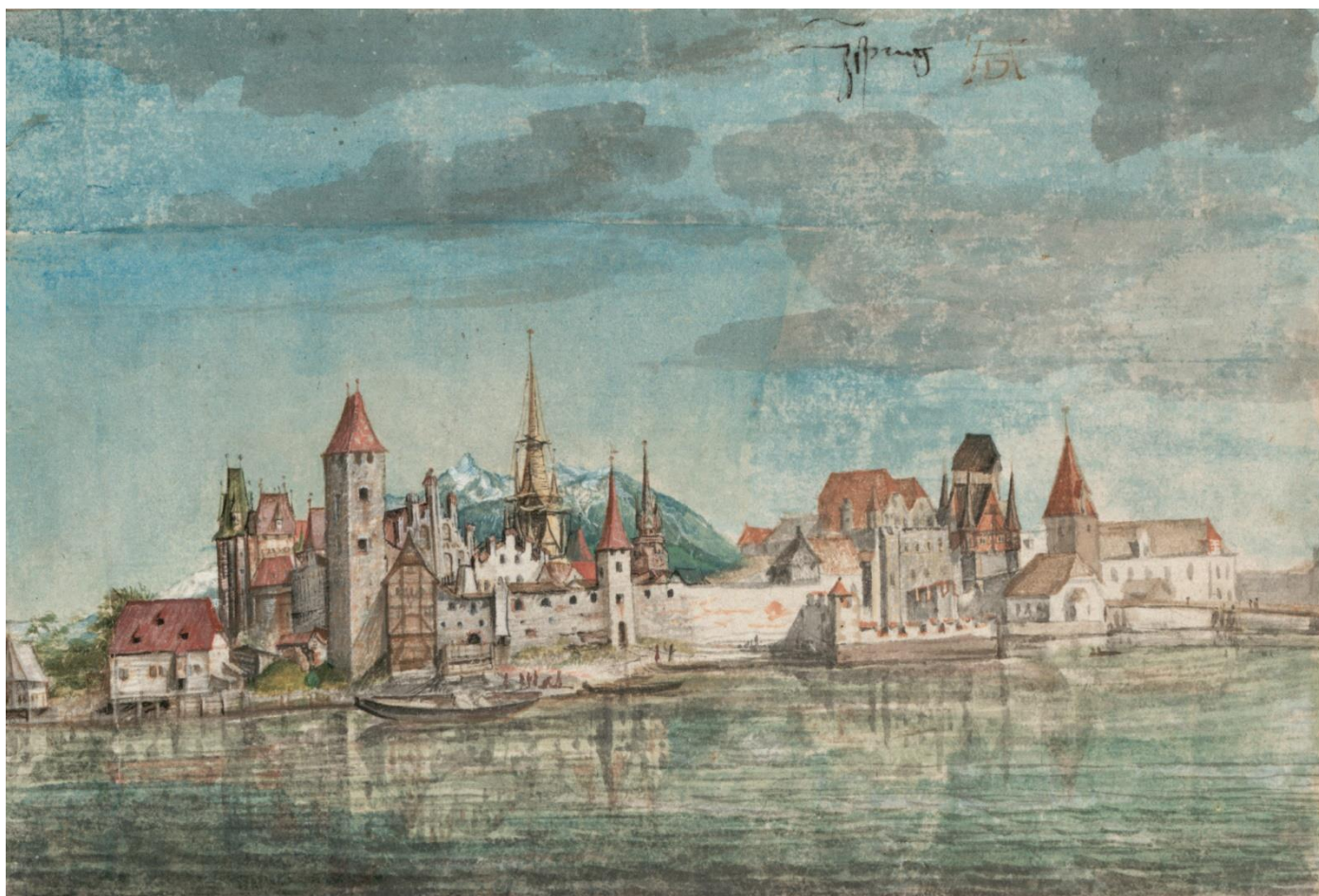
Albrecht Dürer: Innsbruck von Norden, um 1495. Insbruko el nordo. Aquarell. Akvarelo. Albertina, Wien.