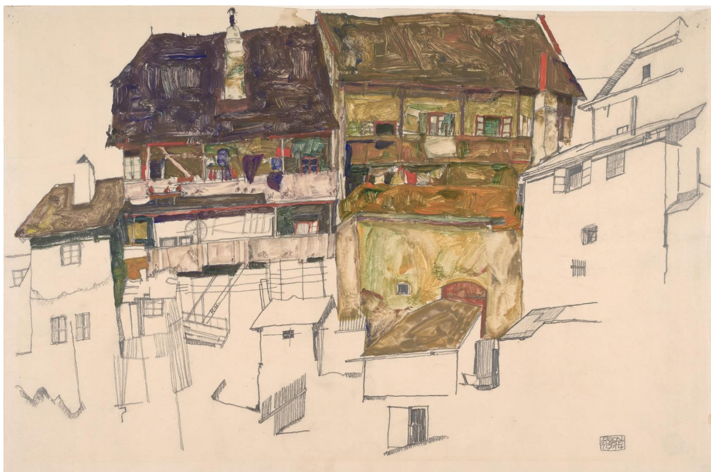
Egon Schiele [ŝile]: Alte Häuser in Krumau, 1914 Malnovaj domoj en Krumau [krumaŭ], nun Český Krumlov en suda Ĉeĥio. Bleistift, Pinsel, Deckfarben auf Japanpapier. Krajono, peniko, kovrantaj farboj sur japana papero. Albertina, Wien.