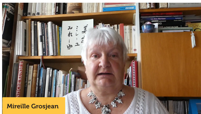
UN 75-jara/Memortago pri Hiroŝimo-Nagasako: Pri Hiroshima kaj Nagasaki