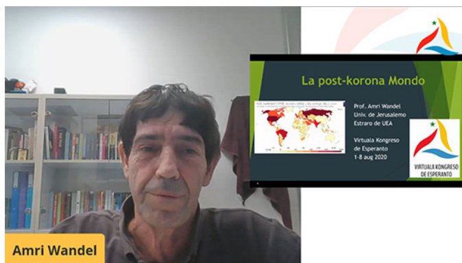
Postpandemia epoko: perspektivoj