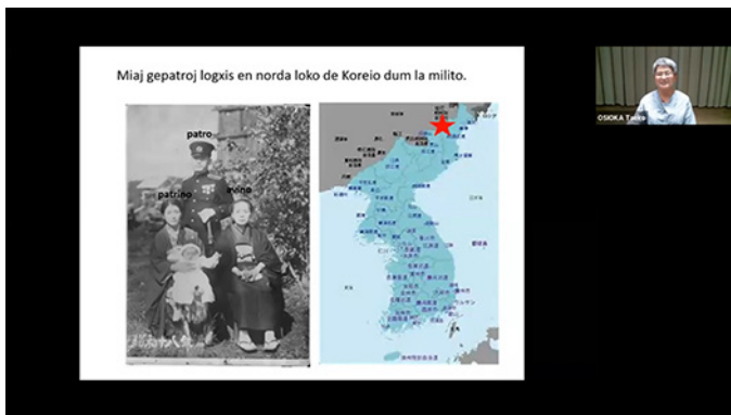
UN 75-jara/Memortago pri Hiroŝimo-Nagasako: Ne plu Hiroŝimon - atesto de atombombito