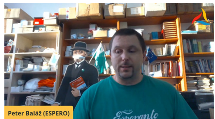
Libroj de la Jaro: Eldonejo Espero