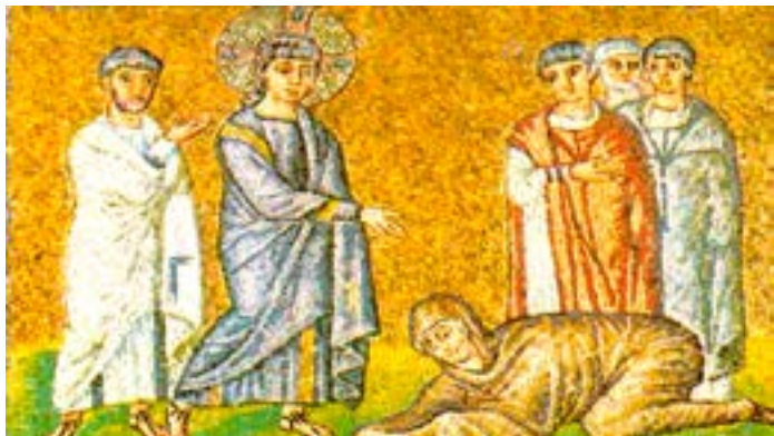
Surmura pentraĵo reprezentanta adultulinon antaŭ Jesuo. 5-a jarcento. Raveno (Italio)