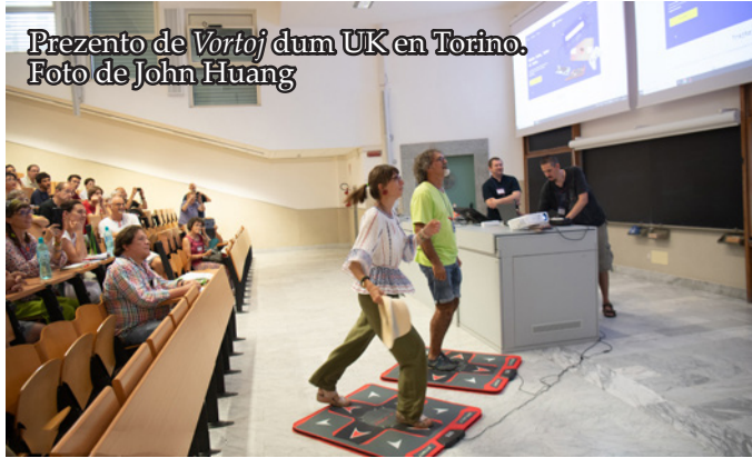
Prezento de Vortoj dum UK en Torino.

Por ke lingvolernado estu efika, ĝi devas esti amuza. Helpe de la ludo Vortoj vi povas praktiki lingvojn kaj ripeti vortojn... dancante! Tiun ludon vi ludas per speciala tapiŝo, do la ludo helpas ne nur plivastigi viajn konojn, sed ankaŭ plibonigi vian sanon. Ĝia nomo estas tute intence en Esperanto, ĉar ĝi estis koncipita en la Esperanta organizo E@I.