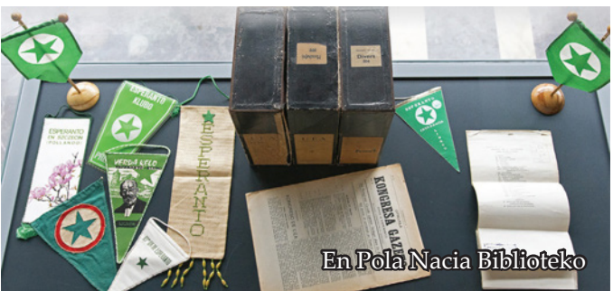
En Pola Nacia Biblioteko