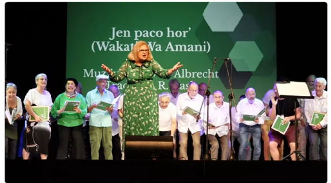
108-a Universala Kongreso de Esperanto, Torino, Italio, 2023.7.29-8.5.