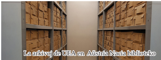
La arkivoj de UEA en Aŭstria Nacia biblioteko

Ne estingiĝas la demandoj pri estonto de la Biblioteko Hodler kaj Centra Ofecejo. La biblioteko trovis novan hejmon en sino de la Pola Nacia Biblioteko (pli detale legu en la revuo Esperanto n-ro 7-8 de la jaro 2023), kaj la arkivoj de UEA restas en Aŭstria Nacia