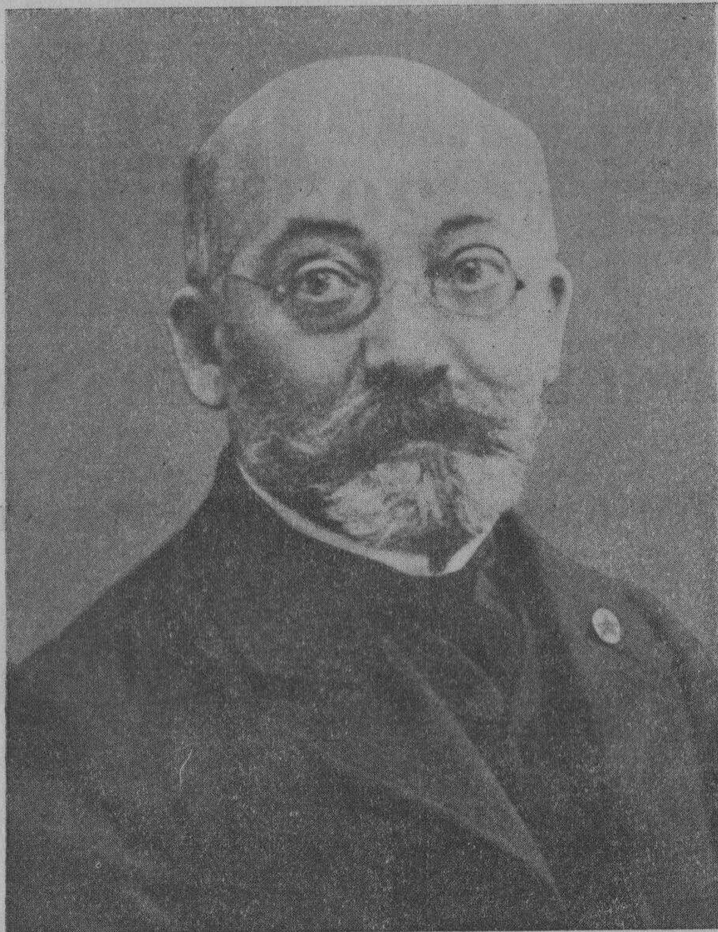
D-ro L. L. ZAMENHOF 15-XII-1859 14-IV-1917