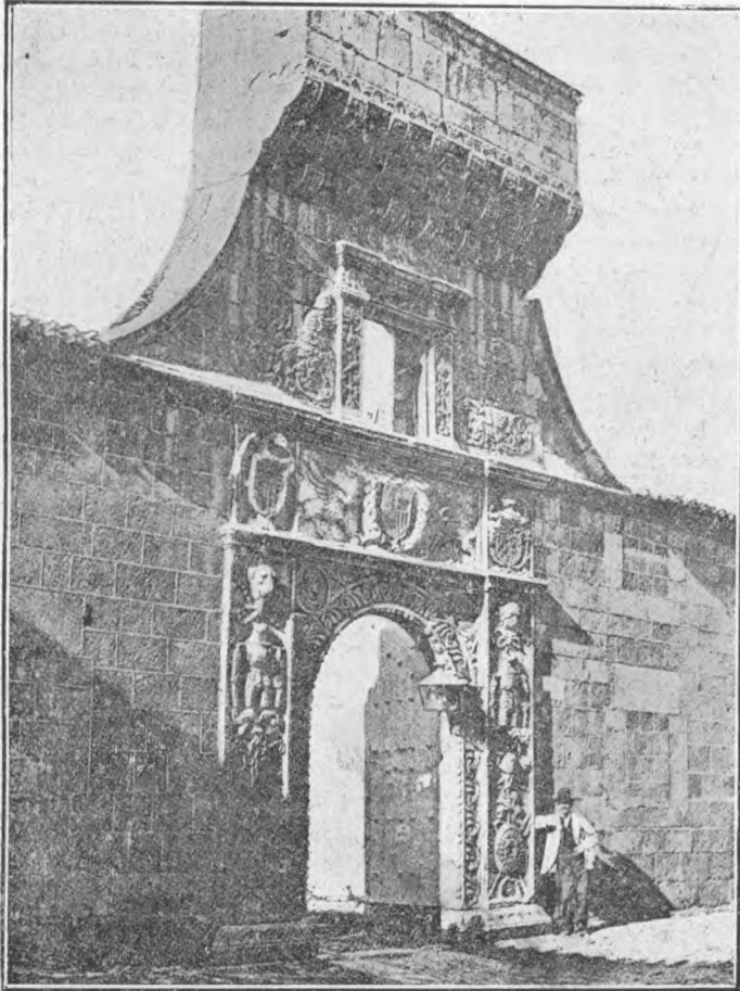
PORDO DE LA PALACO «POLENTINOS» (AVILA)