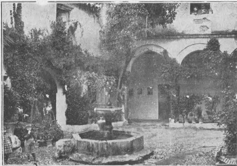
KORTO KUN FONTANO EL CORDOBA