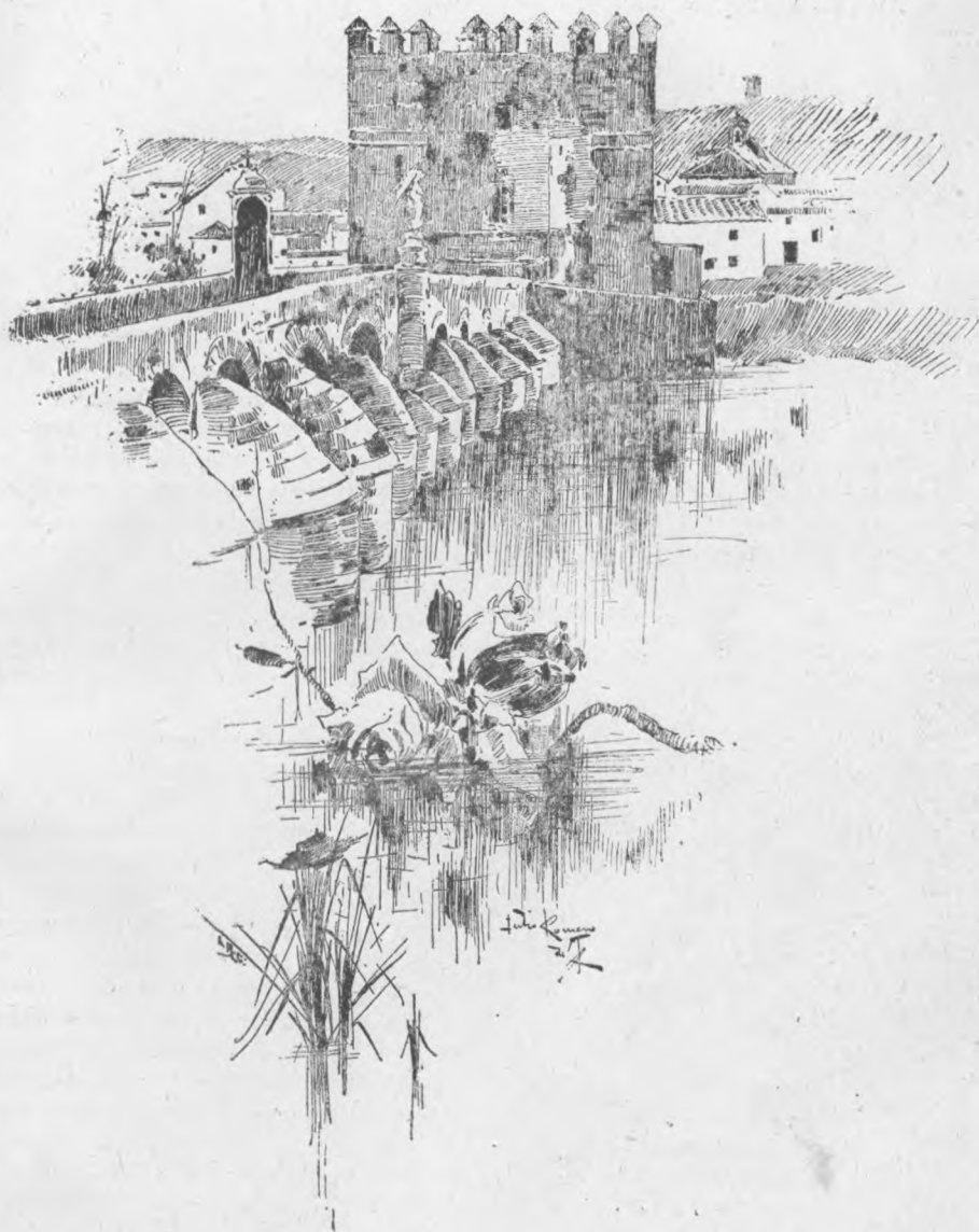
ROMANA PONTO KAJ ANTIKVA TURFORTIKAĴO (CÓRDOBA)