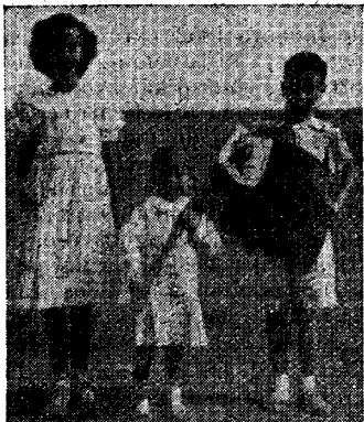
La gefratetoj Quiles (elp. Kiles) Tri fervoraj samideanetoj

Karaj samideanetoj: Mi estas dekjara esperantistido, ĉar jam estis esperantisto, kiam naskiĝis mi, mia dekunu-jara fratino kaj kvarjara. Miaj gepatroj eklernis Esperanton antaŭ 25 jaroj, kaj kiun ili parolas ofte en la hejmo, pro kio ni lernas ĝin paralele gepatra lingvo. Mi kredas, ke se ĉiuj infanoj de la mondo povus ekzisti la Babela Turo, kaj en la lernejo ni ne estus devigataj.