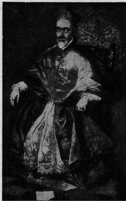
Greco: Cefinkviziciisto Don Fernando de Guevara.

La poezio el tiu epoko montris la saman subjektivismon, kies ĉefa reprezentantino estas Helene Swarth (* 1859; pr.: svart), kiu verkis nesupervideblan serion da sonetoj kaj grandegan amason da kolektoj. Laŭ Kloos ŝi estas »kantanta koro« kaj prave, ĉar sian tutan koron ŝi eldiras per siaj sonetoj: amon, malamon, melankolion, esperon kaj malesperon. Oni komprenas, ke ŝi, nur ser-