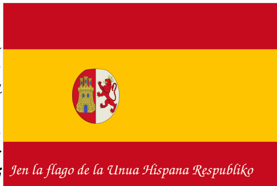
Jen la flago de la Unua Hispana Respubliko