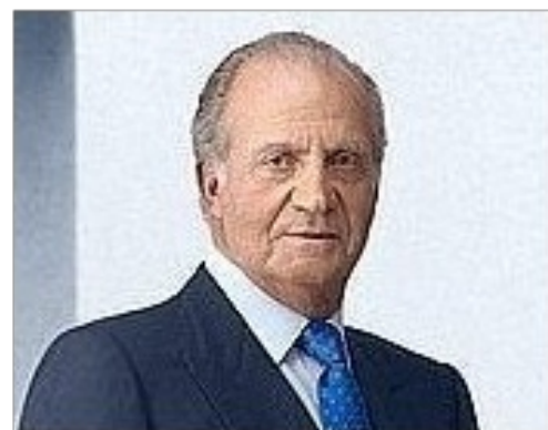
Reĝo Juan Carlos I