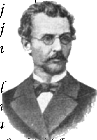
Prus, aŭtoro de La Faraono

Tio havas kiel direktan sekvon, ke nun eblas publikigi la magazinon iom post iom, laŭ la apero de la artikoloj. Kial atendi al publikiga dato? Plej eble kiel frue estas nun, do mi inaŭguras tiun novan epokon de ekskluzive virtuala publikigado per apero de ĉi tiu artikolo, kaj poste mi aldonos la ceteran parton de la kajero, iom post iom, sen hasto, sed sen paŭzo. Kompreneble, tio kaŭzos neeviteblajn ŝanĝojn en ĉi tiu redaktora enkonduka artikolo. Sed oni baldaŭ alkiutimiĝos al tio, mi esperas.