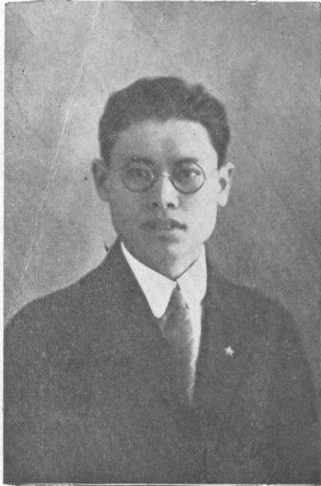
PROFESORO WON KENN

7. e La Konfederacio okazigos Kongreson ĉiujare en malsama regiono,