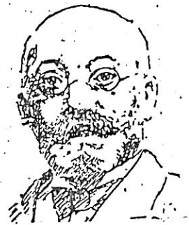
Lázaro Luis Zamenhof

No quisiéramos terminar esta columna sin hacer alguna mención al inventor del esperanto Luis Lázaro Zamenhof, lingüista polaco que nació en 1859 y murió en 1917, quien hace cien años propuso un nuevo idioma internacional, el cual a causa del seudónimo de «Doctor Esperanto», que empleaba su autor, recibió el nombre de esperanto . Zamenhof compuso también un diccionario esperanto - francés - inglés - alemán - ruso - polaco y otros diccionarios especiales para los principales idiomas, basados en su creación lingüística. Además, vertió al esperanto la tragedia Hamlet, de Shakespeare, y escribió en esta lengua algunas obras, como la Historia del Esperanto y Lengua Internacional. De todos los idiomas artificiales, el esperanto es el que ha alcanzado mayor difusión. Reproducimos el primer