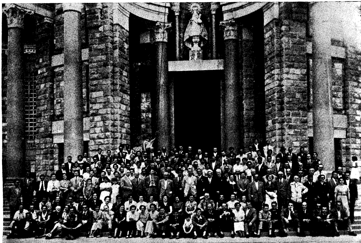
La kongresanoj antaŭ la kapelo de la Labora Universitato.