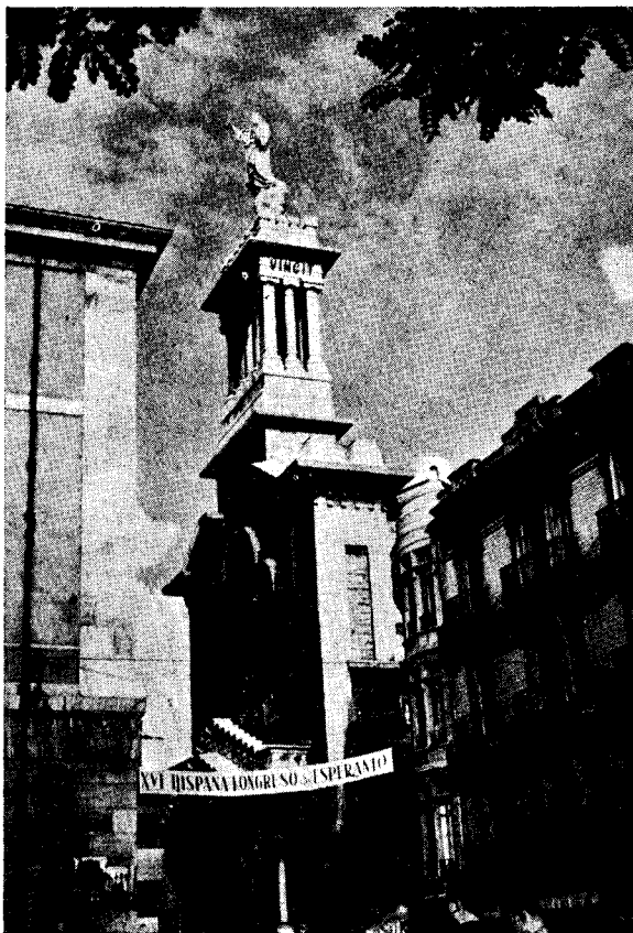
La preĝejo de la Sankta Koro antaŭ la kongresejo.