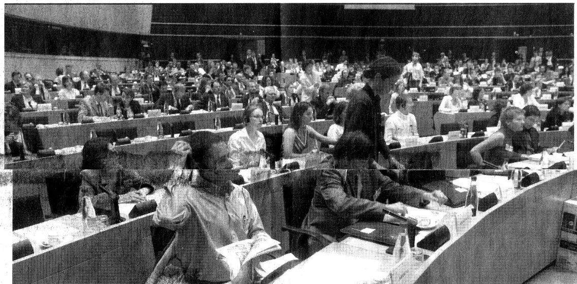
On parle sérieusement de l'espéranto au Parlement Européen. En avril 2004, les députés européens ont eu à voter sur un amendement proposé par l'Italien Dell'Alba et proposant de retenir l'espéranto comme langue-pivot pour les débats parlementaires. 120 parlementaires sur 280 votants (43%) ont voté pour.

De plus amples renseignements sur : http://www.esperanto.net .