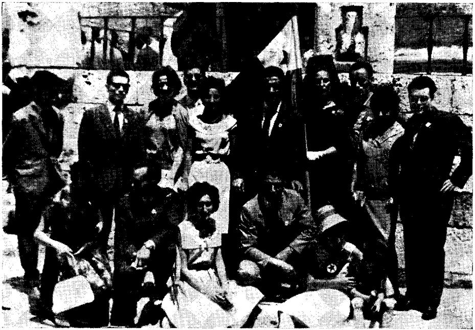
H. E. J. S. kunvenis en Valladolid.