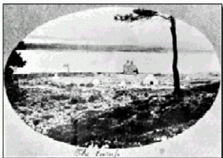
La unua monda skolta tendaro Brun-mara Insulo - 1907 (rimarku la blankajn konus-formajn tendojn)