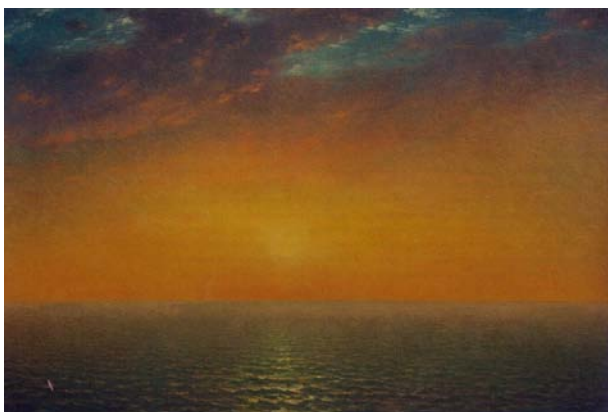
"Sunsubiro en la maro"

Kiu vin sanktis, vin portugal' kreis. Pri l' mar' kaj ni, en vi, al ni signalis. Iĝis la Mar', maliĝis l' Imperio. Sinjor', mankas la temp' Portugalia!