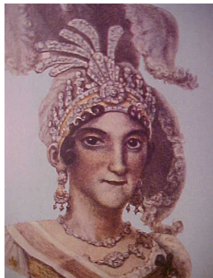
Don Karloto (1775-1830) edzino de Don Johano la Sesa

Jam denove en Portugalio, en kompleksa enlanda milita situacio, en kiu Don Mikaelo, fie misgvidita de la patrino, ribelis kontraŭ la patro, Don Johano vokis lin ĉe si, kaj havis moralpatran forton por finigi la militon,