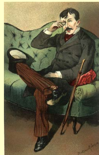
“Eça de Queirós” Rafael Bordalo Pinheiro

Diplomato, kiu loĝis en Portugalio, Britio, Egiptio kaj Francio, sin dediĉis ĉefe al la romana ĝenro, unue naturisma kaj poste realisma. Verkis li kelkajn rakontojn, kies trajtoj foje montras la teknikon de la romanoj. “A aia” estas eble la rakonto, en kiu Eça plej bone enkadriĝas en la rakonta ĝenro. La simileco de ĉi tiu rakonto kun la popularaj rakontoj, laŭ la tekniko de rakontado, estas evidenta. “A aia” estas unu el la rakontoj plej legataj, kaj literature studataj, de la lernantoj en la portugaliaj lernejoj.