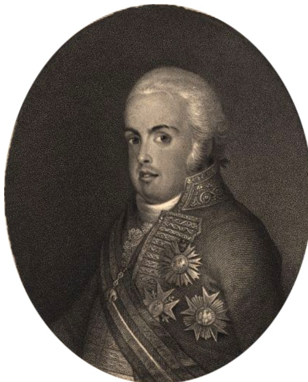
Don Johano La Sesa, reĝo de Portugalio

Don Johano La Sesa atendis do kaj la francojn kaj la anglojn, kies ambaŭaj intencoj estis la subiĝo de Portugalio al iliaj povoj, kaj kune kun Portugalio subiĝus ties kolonioj: Brazilo, Angolo, Mozambiko, Gvinebisaŭo, Kaboverdo, Santomeo kaj Princo, la portugaliaj kolonioj en Hindio, Timorlesto kaj Makao. La tiama milita forto de Portugalio estis praktike nula, des pli se oni komparas ĝin kun la franca kaj la angla potencoj. Kion faris la portugalia reĝo Don Johano La Sesa? Antaŭ ol respondi al tiu demando, oni komprenu, kiu estis Don Johano La Sesa, kiel