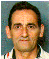
de Dimitrije Janicic