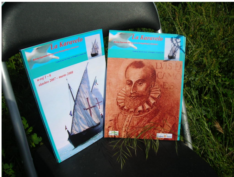
La unua kolekto de La Karavelo (numeroj 1 ĝis 6). Live la antaŭbando, dekstre la postbando.