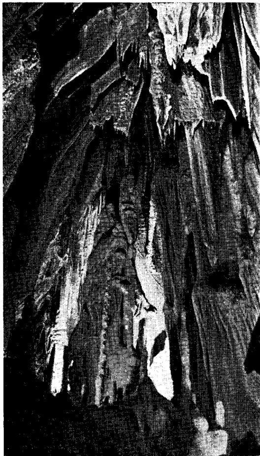
Rokeca interno de la kavernoj: "Altaro de la Virgulino".

En Guernica ni povos viziti la faman "Casa de Juntas" (Domo por Kunvenoj), en kies arkivo situas en honora loko ŝranko el mahagono sur kiu oni povas legi jenan frazon skribitan per argentaj literoj: "BIZKAIKO LEGE ZARRA" en eŭskera lingvo, kio en Esperanto signifas: "la Malnova Leĝo de Vizcaya". En ĝi konserviĝas la originalan ma-