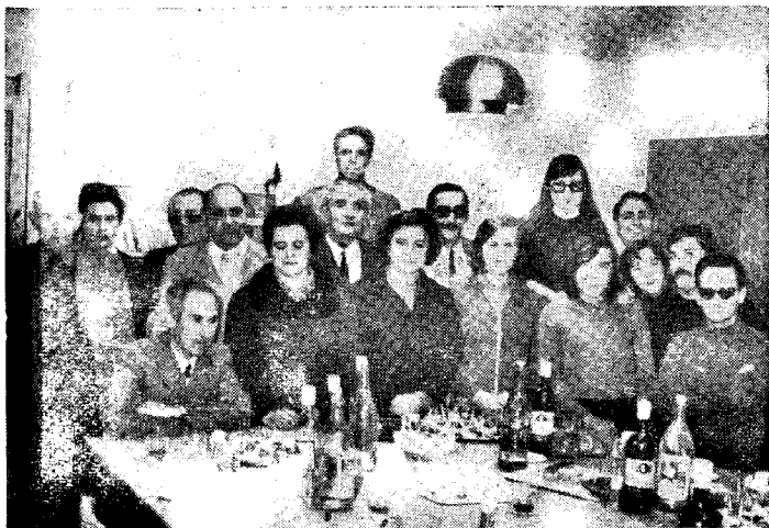
Grupeto da invititoj en la festo