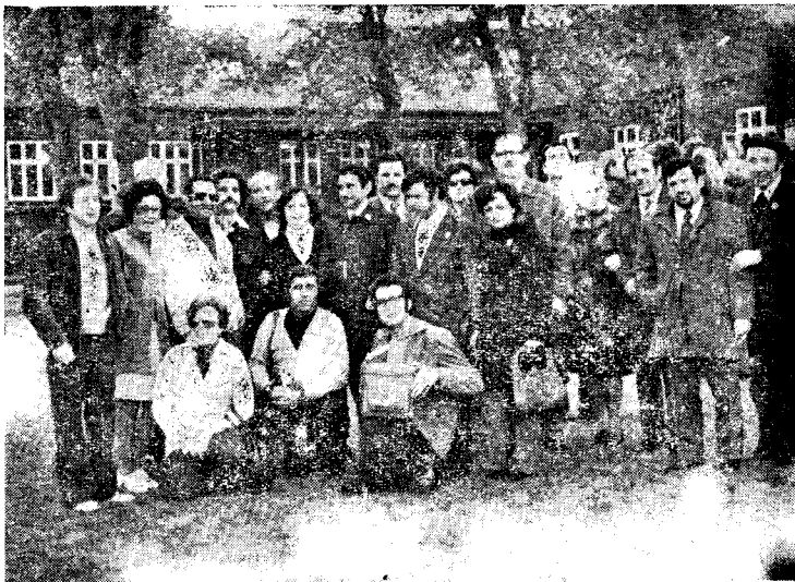
Hispanaj gekongresanoj antaŭ la vagonfabriko "SKANDIA"

Per la salutvortoj de la Hispana Delegito, ĉiuj partoprenantoj estis invitataj viziti la 26-an Kongreson de I.F.E.F. okazonta en Tarragona de la 11-a ĝis la 17-a de Majo 1974. Samtempe, li transdonis belan reproduktaĵon de la romia mozaiko "La Medusa" donacon de la urbestro de Tarragono al la urbestro de