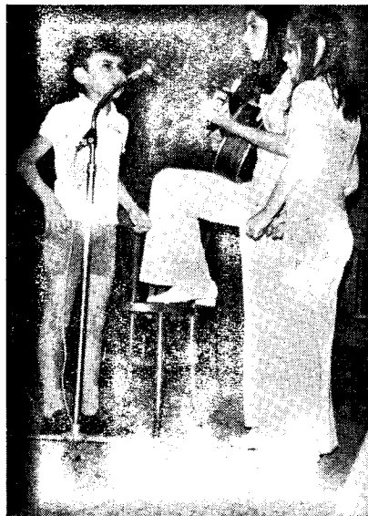
La infana trupo de Sta. Coloma de Gramanet, kantas en Esperanto

Paŭzon en la salutado faris la Infanhoro per kanzonoj en Esperanto, unu el ili Sardano-muziko, kies tekston en Esperanto originale adaptis membroj de Centro de Esperanto Sabadell.