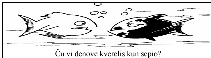
Ĉu vi denove kverelis kun sepio?