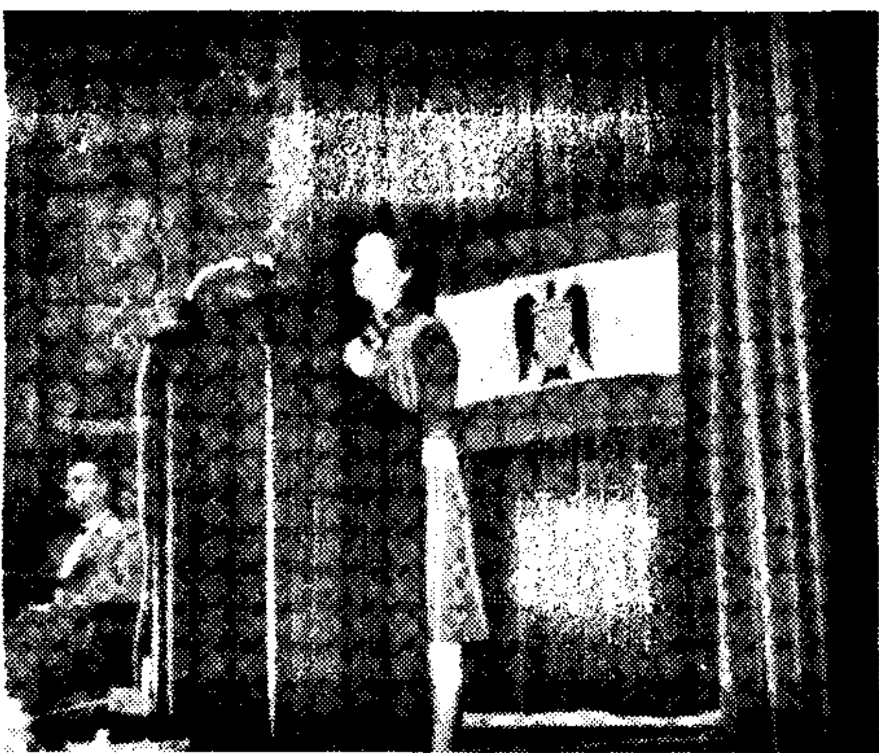
La Prezidantino de H.E.F. dum la parolado, okaze de la solena inaŭguro

Posttagmeze: Laborkunsido de estraro de H.E.F. kun delegitoj de Grupoj kaj sekcioj.