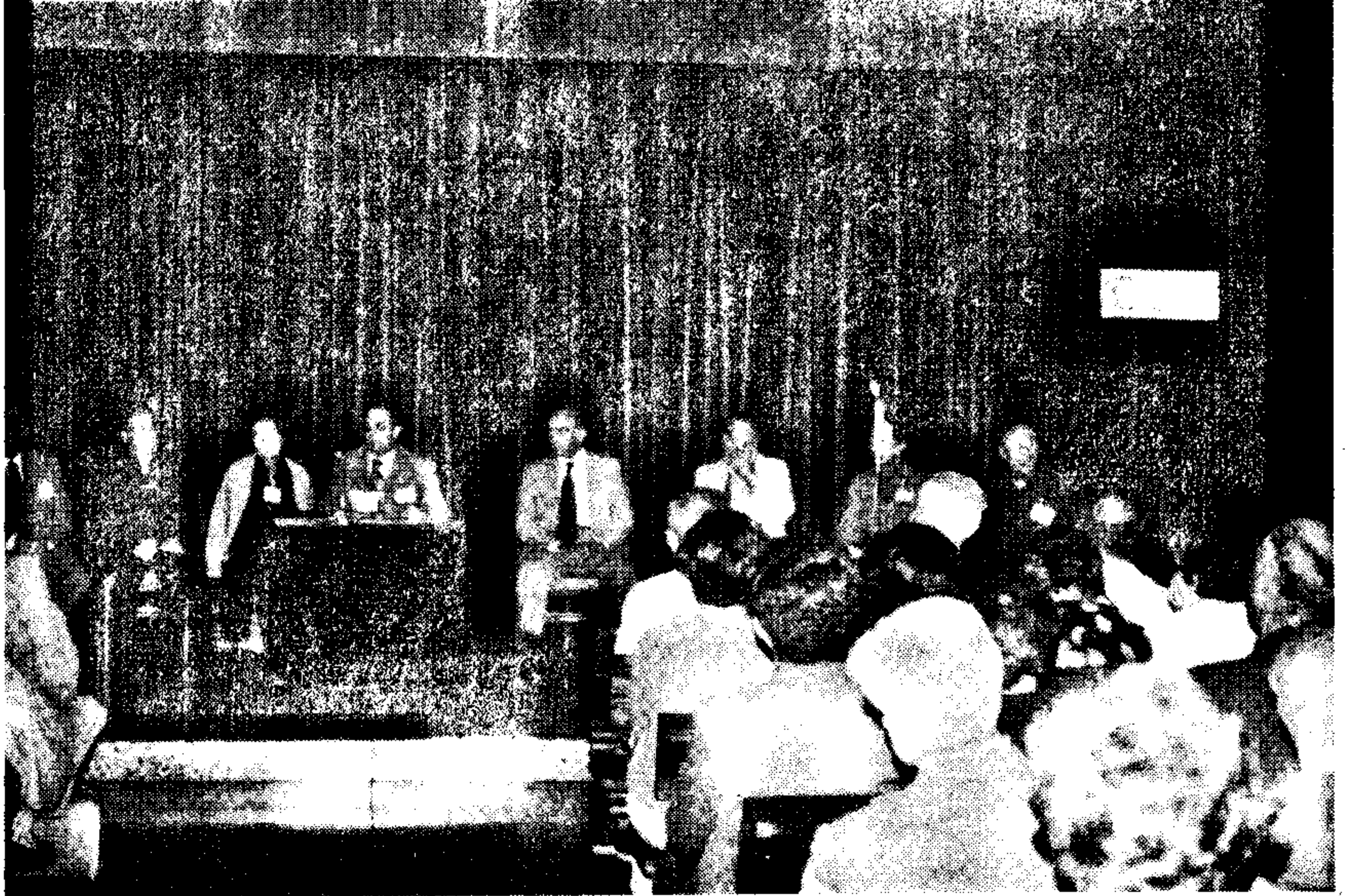
Fermo de la kongreso en la salono de la kongresejo