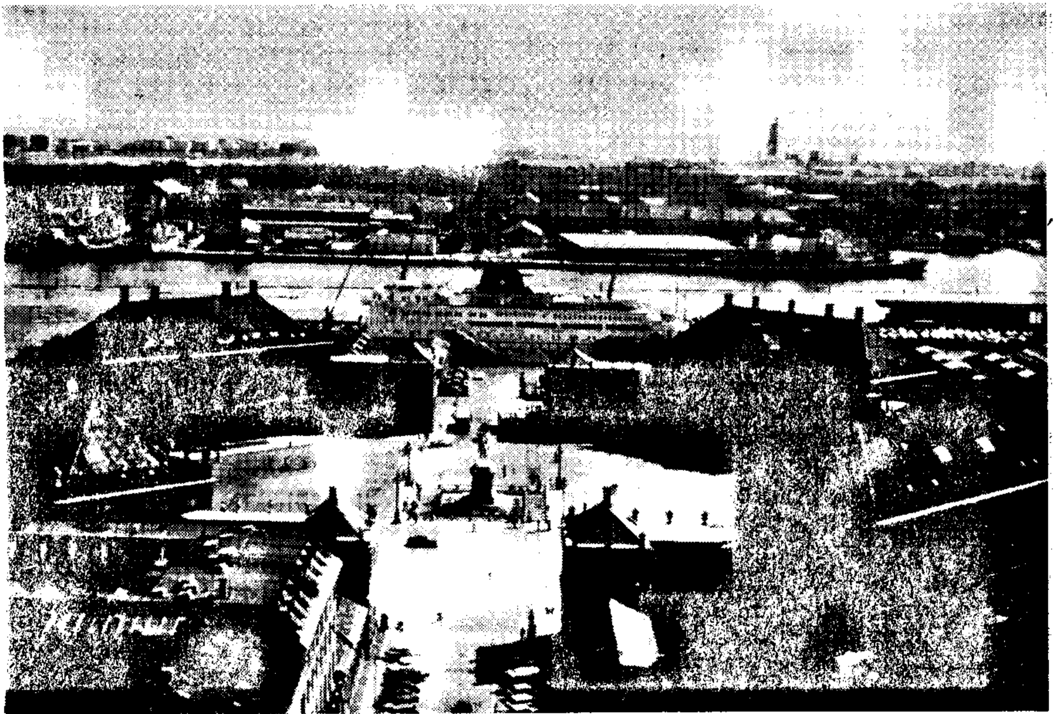
Reĝa Palaco

Post nia tritaga halto en Kopenhago, komenciĝis la rondirado tra la lando por prezenti, ĉe la koncernaj lokaj Esperanto-Grupoj, la prelegon sub la titolo: «Hispanio-hieraŭ - hodiaŭ - morgaŭ». Pere de duonhora parolado, mi povis konigi al la ĉeestantaro, skizante historion de nia lando kun ĉefa klarigado de la agoj de nia civila milito, la post militaj tempoj, la nuna situacio kaj la espero de la hispanoj pri la estonteco. Tuj mi prezentis 80 kolorajn diapozitivojn pri la ĉefaj vidindaĵoj tra la lando kun