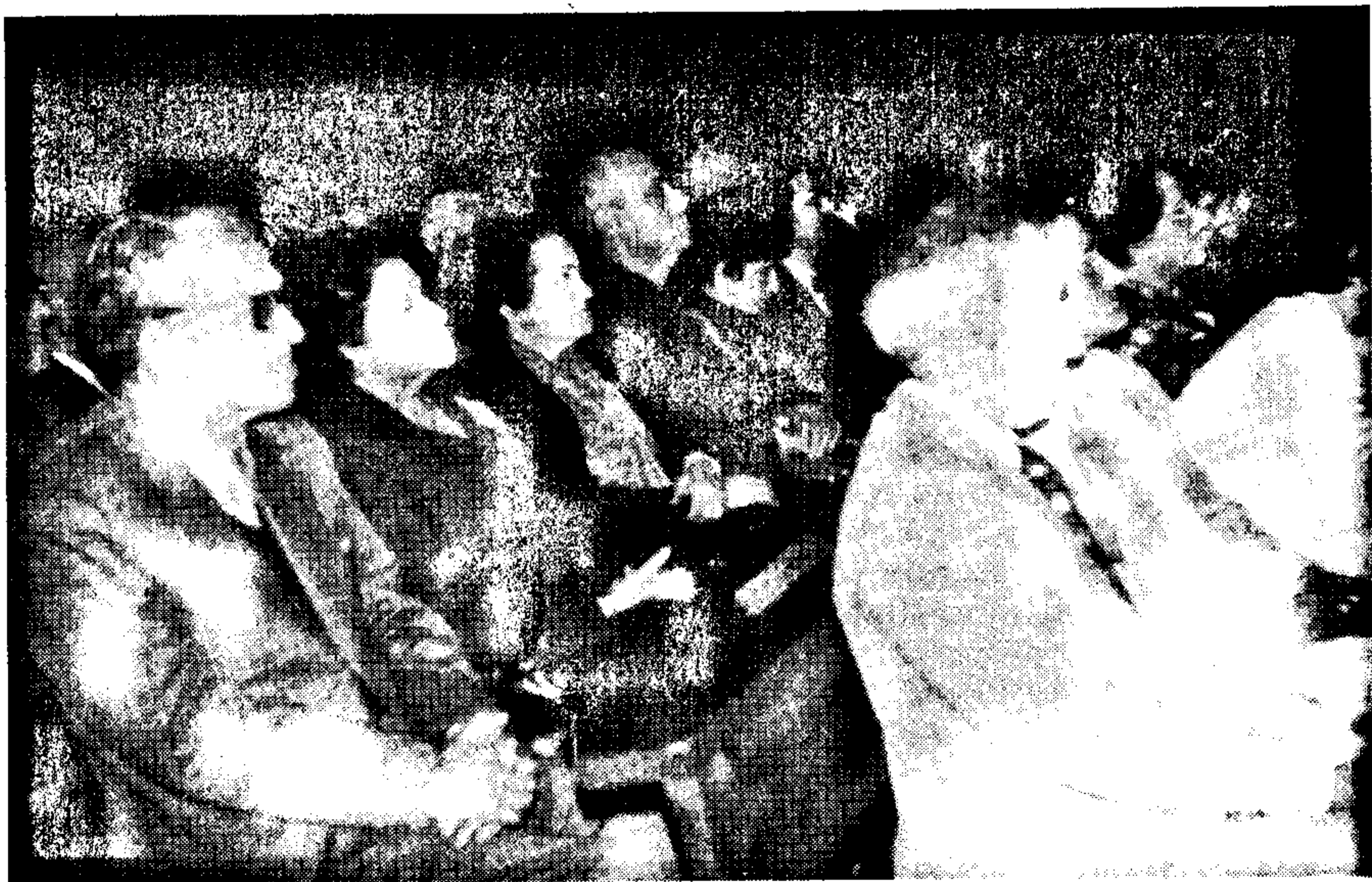
La gekongresanoj atente aŭskultas interesan prelegon

Komparante la nebonajn rezultojn de la menciita agado, li estigis specialan kritikon kun la celo atingi ke, estontece oni korektos tiajn esperantismajn malsanojn por la bono de la disvastigo de Esperanto en la mondo.