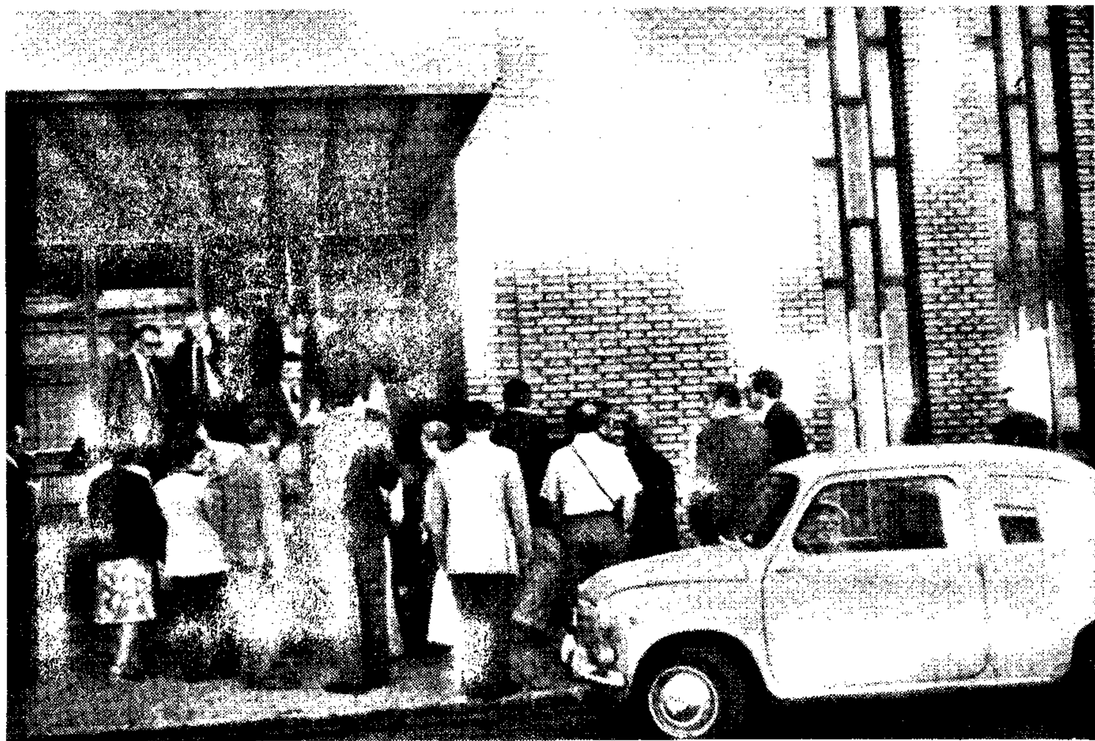
Gekongresanoj ĉe la pordo de la Kongresejo.

Dekstre de la rivero Bernesga kaj en konfluejo kun la rivero Torio elstaras León . Ĝi troviĝas en la kadro de tre vasta kaj arboplena valo kiu, krom ĝia natura beleco, estas fonto de laboro kaj riĉeco, ne nur por la leonanoj sed ankaŭ por la tuta provinco.