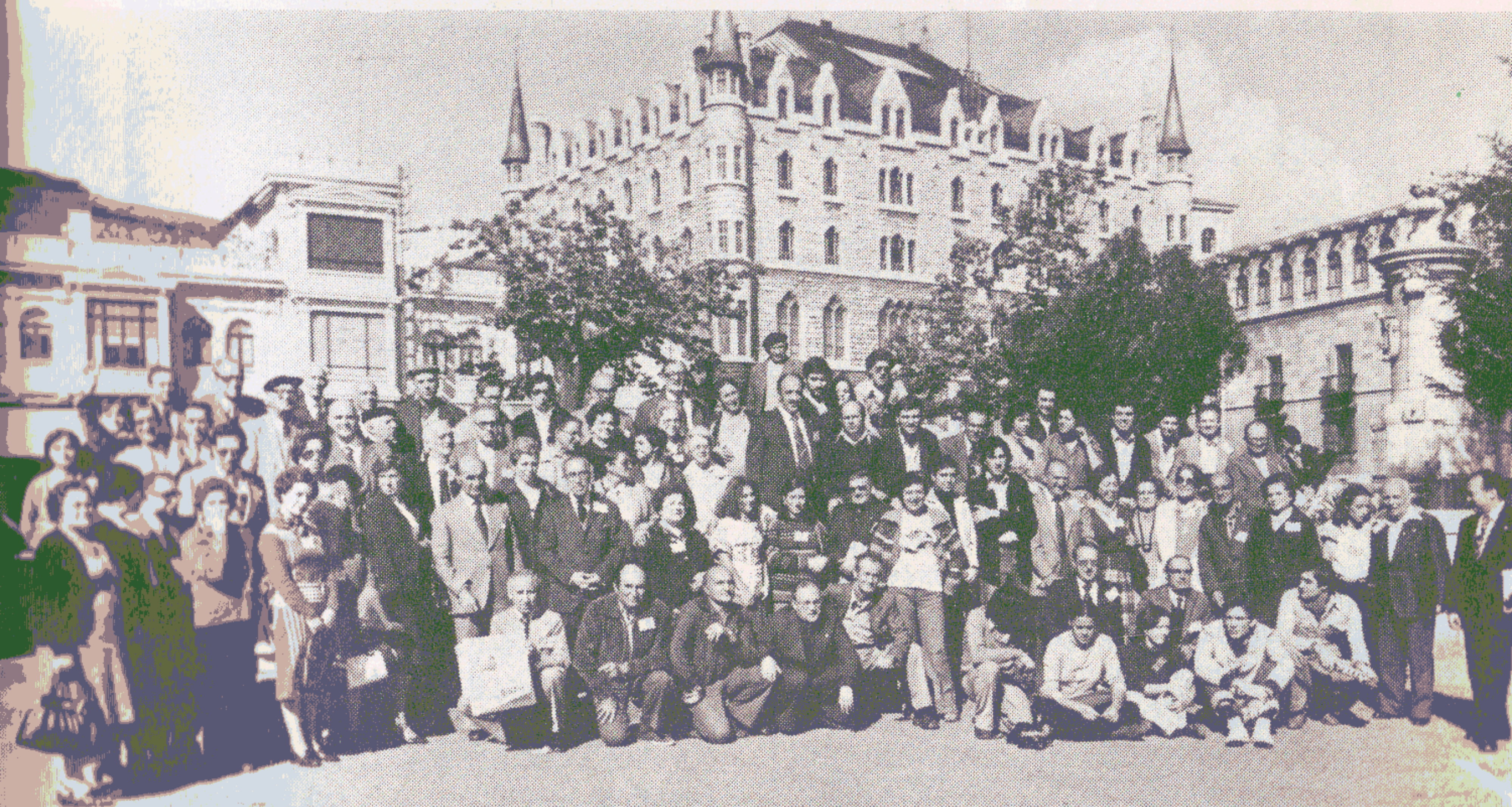
Grupo da gepartoprenantoj en la XXXVIII-a Hispana Esperanto Kongreso en León.