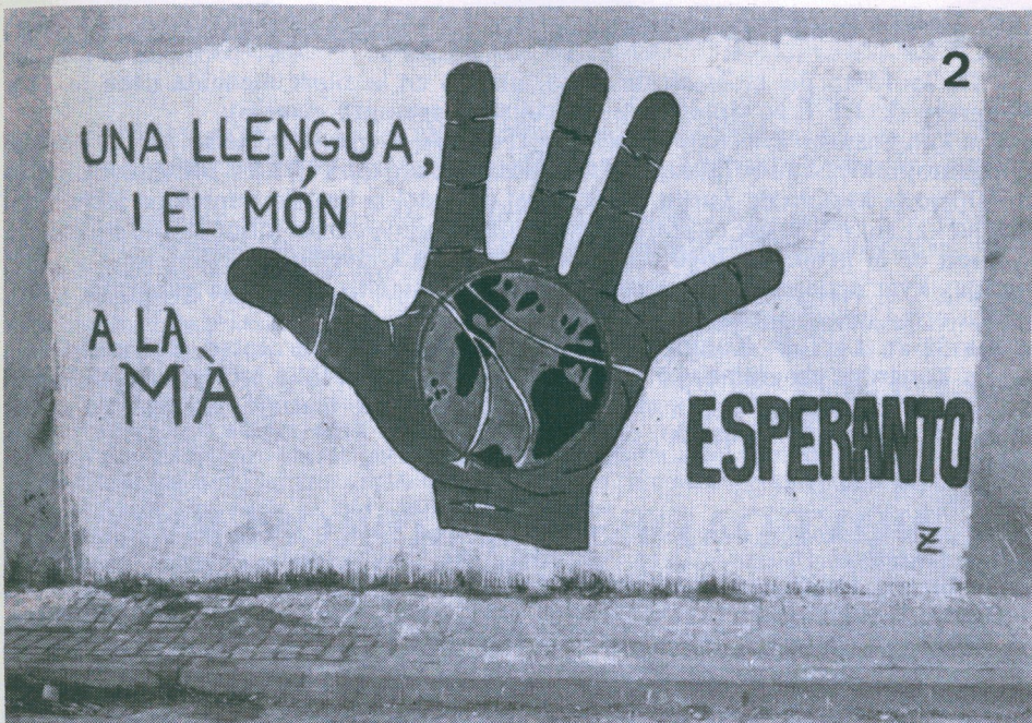
Multkolora pentraĵo sur le muro, altiros la atenton de ĉiuj pri la lingva problemo. (Sabadell).