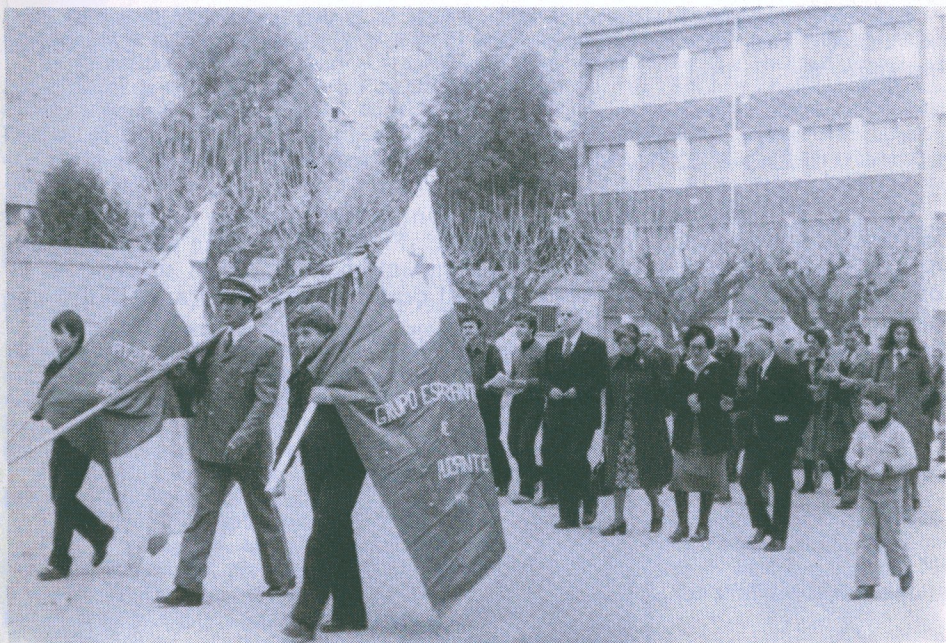
Estraranoj kaj blorkestro foriras el la Nacia Kolegio ĝis la Publika Ĝardeno, en Callosa de Segura.