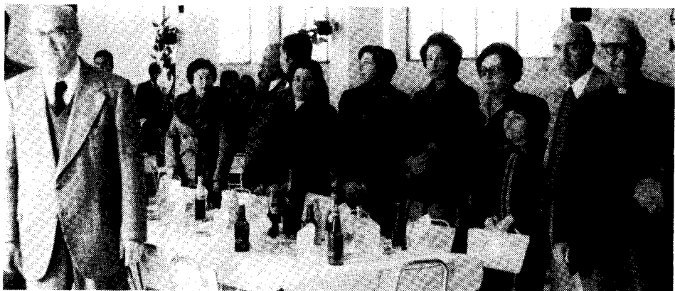
I.L.E.I. Estraranoj kaj Delegitaro pozas dum la Honora Vino.

Semajno de la Homaj Rajtoj kaj Esperanto en Callosa de Segura, 17 dec. 78