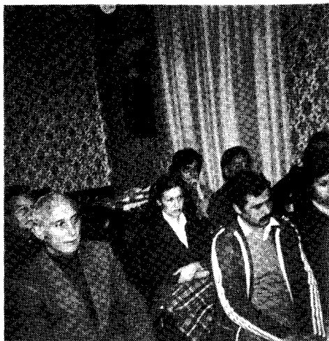
Membroj de Fido Kaj Espero atente aŭskultas interesan prelegon

Komunikado». Ŝi komencis sian interresan kaj bone dokumentitan prelegon, menciante la kialojn por ke la esperantistaro kune celebras ambaŭ eventojn, dirante ke «vere ekzistas rilato, ĉar Zamenhof estis homo kiu helpis, per sia kreado de Internacia Lingvo, la internacian komprenon, la internacian edukadon, faciligante la voĝaĵojn inter landoj helpe de komuna neŭtrala lingvo».