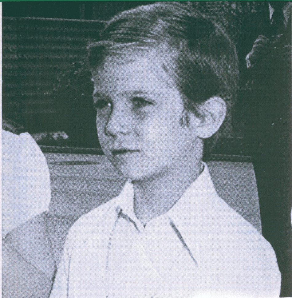
La Princo de Asturias D. Felipe de Borbón y Grecia HONORA PREZIDANTO de la 39-A HISPANA KONGRESO DE ESPERANTO