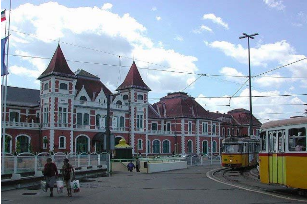
Miskolc – Vasútállomás Miskolc – Fervoja stacidomo