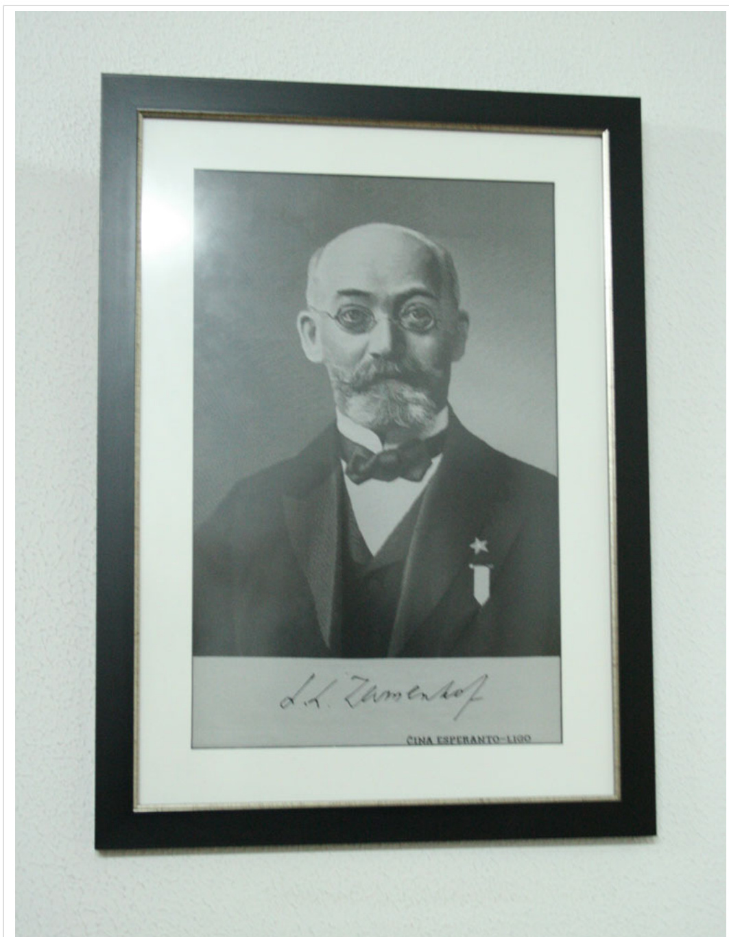
Retrato ubicado en la sede de esperantistas de Santander, del fundador del Esperanto. El doctor Zamenhof