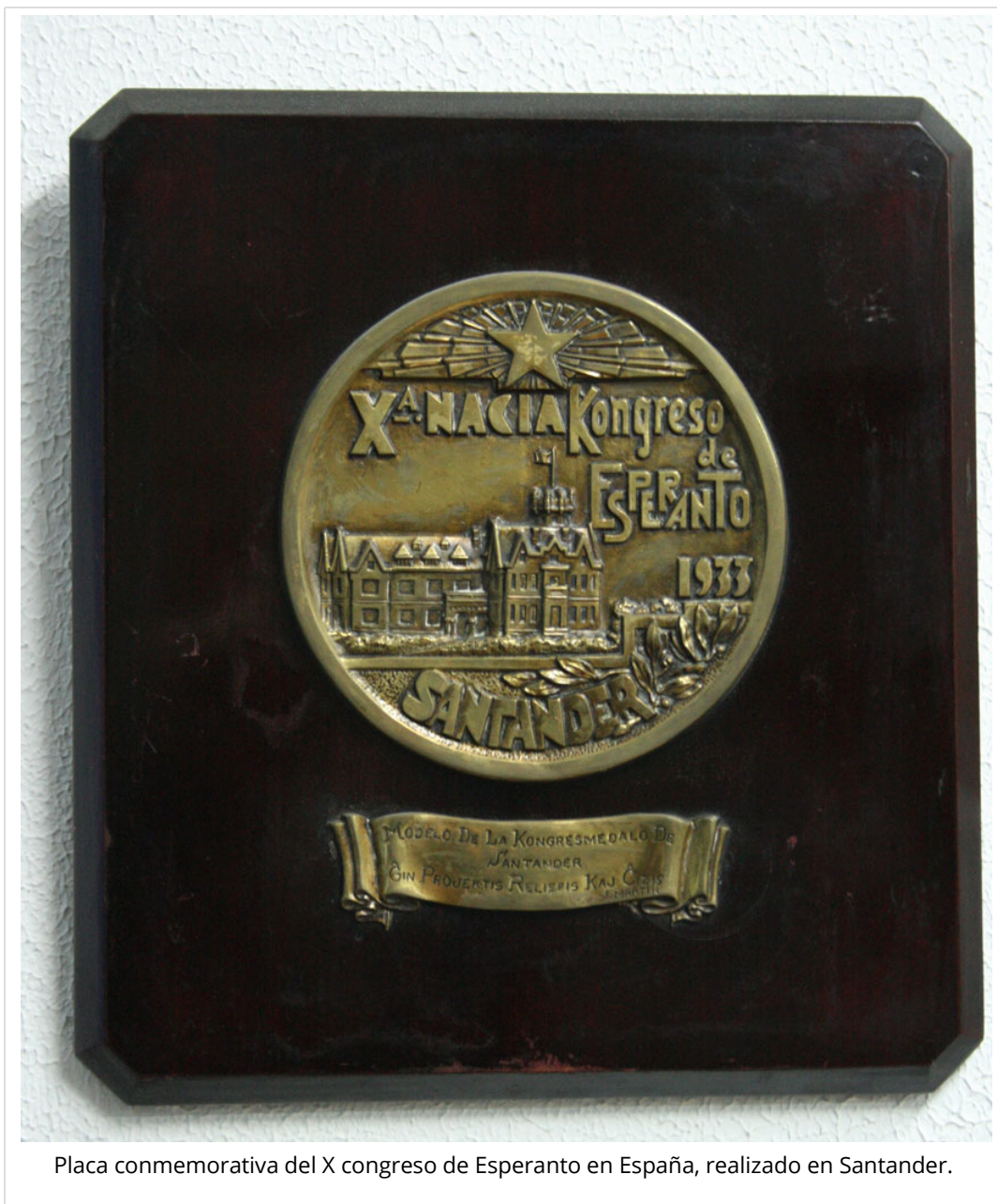
Placa conmemorativa del X congreso de Esperanto en España, realizado en Santander.