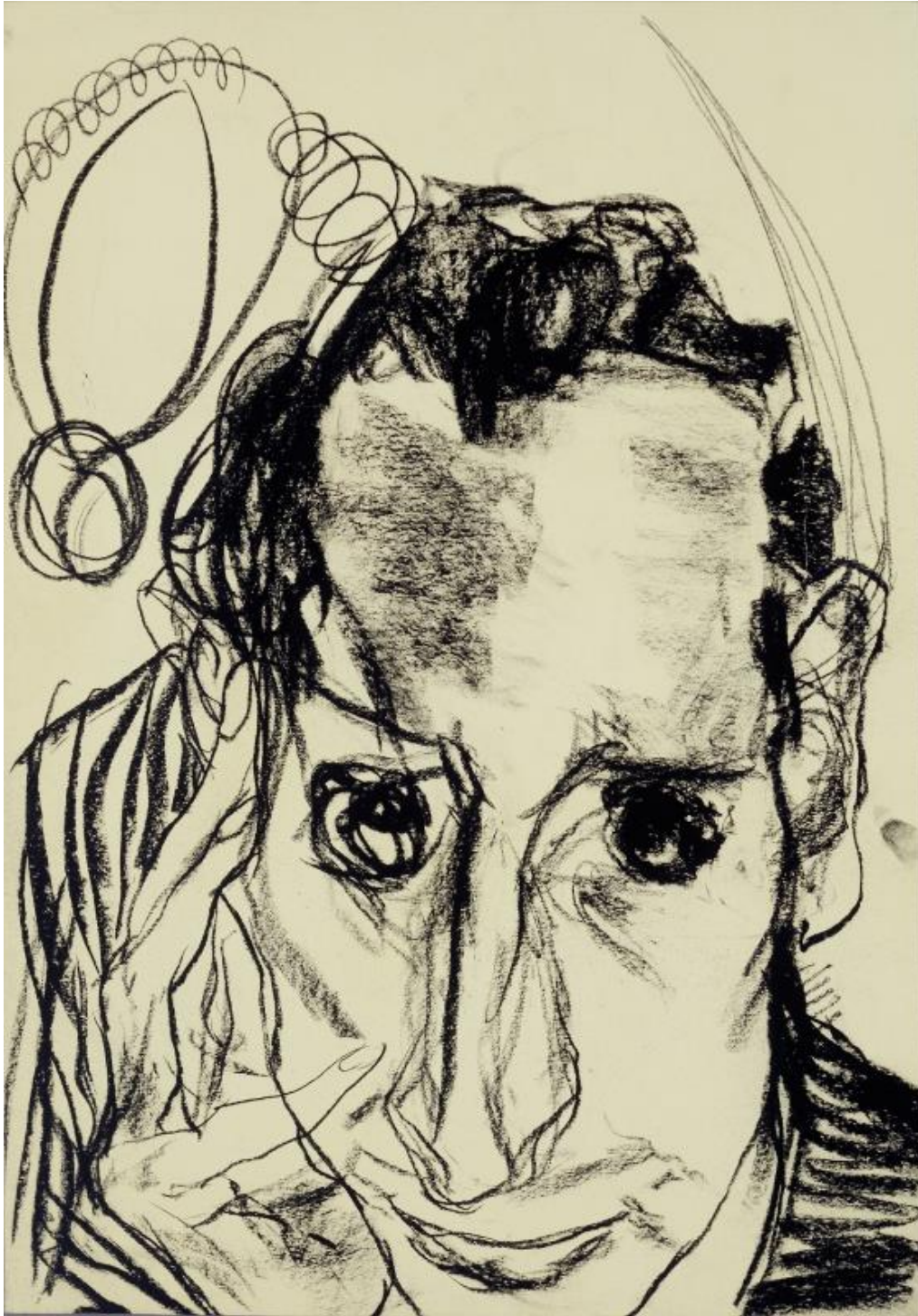
EDMUND KALB, Selbstbildnis, 1930 © Privatbesitz