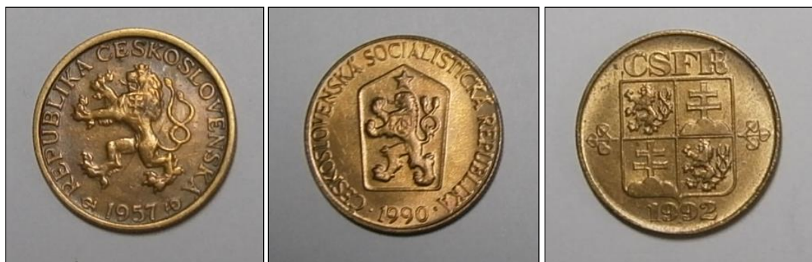
blazono de ĈSR

Dum la tempo ŝanĝiĝis averso de la monero laŭ ŝanĝoj de la ŝtata sistemo – de la 2a de septembro ĝis la 30a de novembro tie estis malgranda blazono (kronhava leono) de Ĉeĥoslovaka Respubliko (ĈSR). De la 1a de decembro 1961 ĝis 30a de marto 1990 tie estis la blazono (stelhava leono) de Ĉeĥoslovaka Socialisma Respubliko (ĈSSR) kaj de la 1a de aprilo 1990 ĝis la 31a de decembro 1992 la nova blazono de Ĉeĥa kaj Slovaka Federacia Respubliko (ĈSFR):