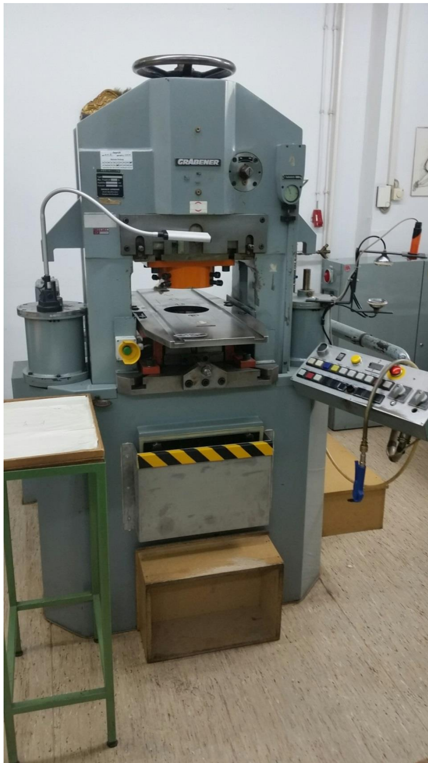
La pregomaŝino de la firmao Gräbener Pere de tiu maŝino pregiĝis la 100-Steloj-moneroj en Vieno