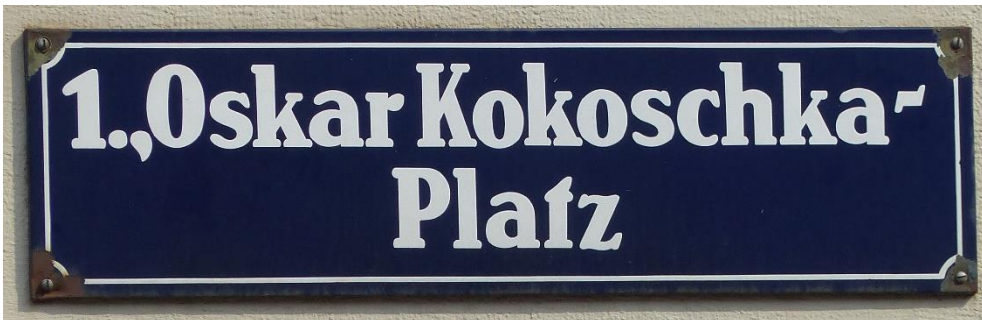
Vieno, 1a distrikto. Fotoj: Walter Klag 2019