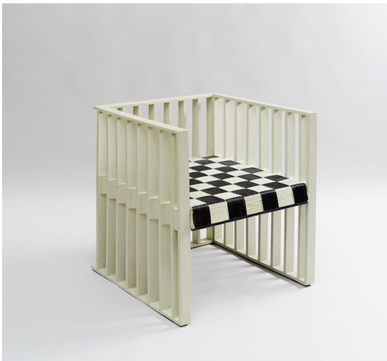
Koloman Moser, Armlehnstuhl für das Sanatorium Purkersdorf. Brakapogila seĝo por la sanatorio Purkersdorf apud Vieno, 1903.