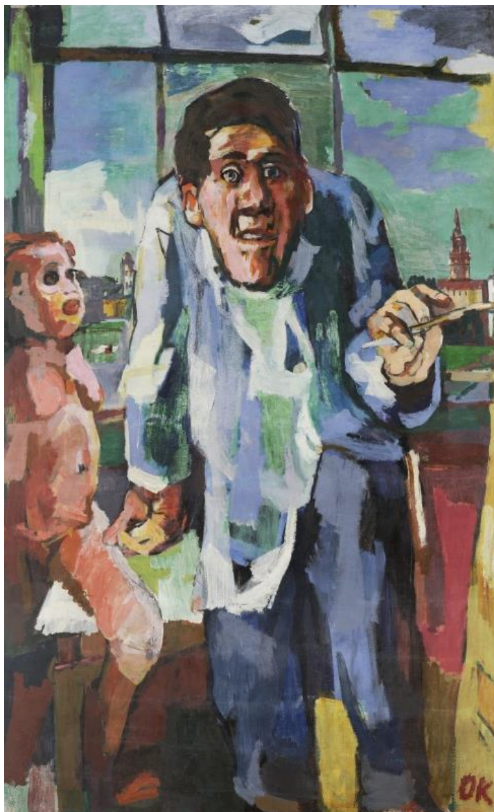
Oskar Kokoschka, Selbstbildnis an der Staffelei. Memporetro ĉe la pentrista stablo, 1922.

representanto de la moderna pentroarto. Leopold-Muzeo posedas la plej grandan kolekton de la bildoj de Gerstl.