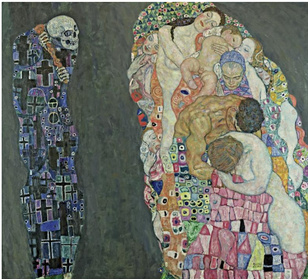
Gustav Klimt, Tod und Leben. Vivo kaj Morto. 1910/11, revizie tralaborita 1915/16.