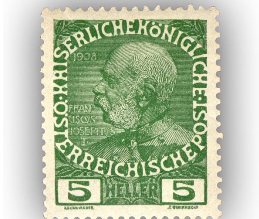
Poŝtmarko, Kolo Moser, 1908. Sur la bildo imperiestro Francisko-Jozefo.

Usona Koktelejo, American Bar aŭ Loos-Bar; ĝi troviĝas en la unua distrikto de Vieno, en Kärntner Durchgang.