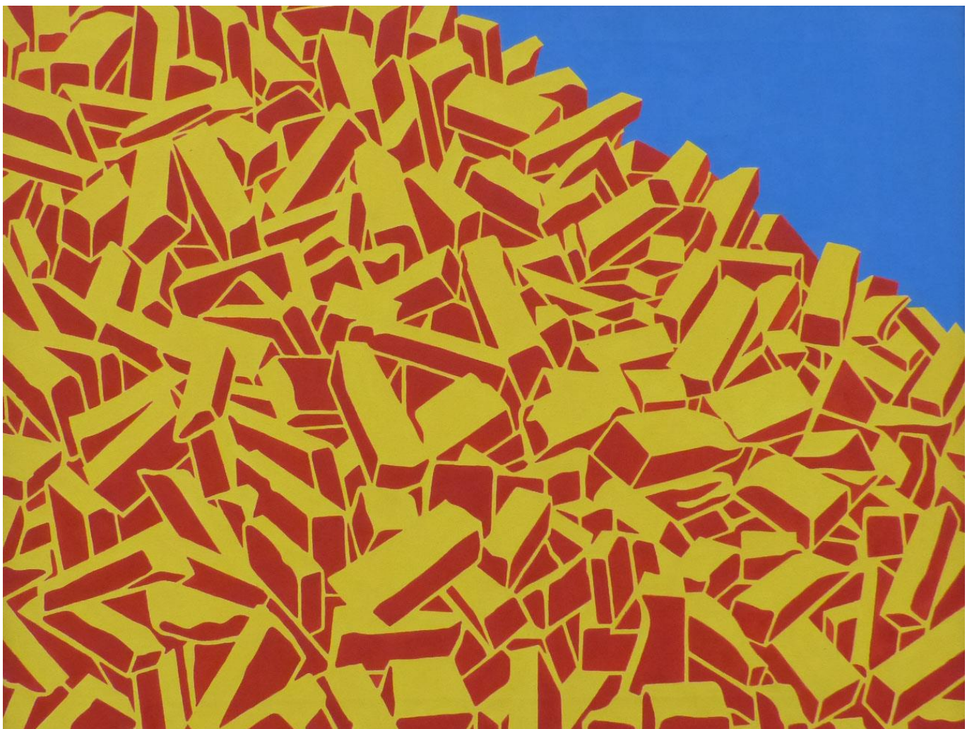
Florentina Pakosta: Peco da Blua Ĉielo, 1988. Oleo sur lino. Suppan Fine Arts.

„Agresemaj Movaj Sekvencoj”: Tie la emocia moviĝado plej gravas. La nekalkulebleco de emocioj estas bildigita. Tiu nekalkulebleco rilatas al