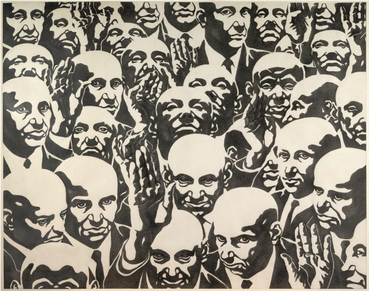
Florentina Pakosta: Samtempuloj, 1982. Albertina. Bildrecht Wien 2018