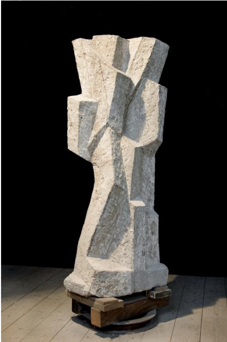
JOSEF PILLHOFER: Duobla figuro, 1958