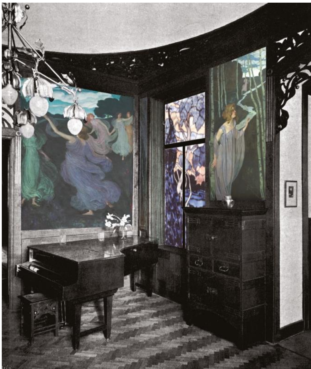
Fotomuntado de la betovena muzikĉambro de la vilao Scheid [ŝajd] Fotomontage des Beethoven-Musikzimmers der Villa Scheid, 1898/99