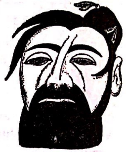
Itala delegito Grandi

Antaŭ ol la komenco de la Ne-Interveno, Germanio k Italia abunde provizis la ribelulojn; sed post alpeno de la fama komitata decido, tiuj nacioj ruze perfidis konstante sian subskribon, kiel ĉiam ili agis.