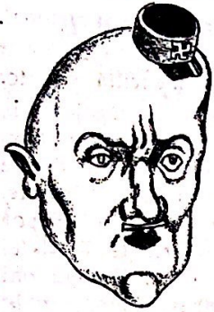
Germana delegito Von Ribbentrop