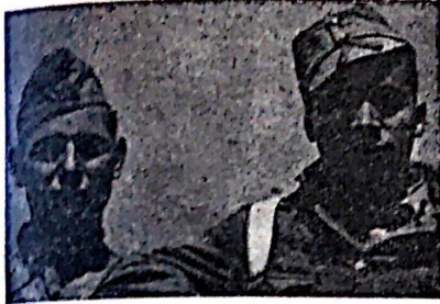
Du junaj maŭroj, forkurintoj el faŝista kampo, kiuj nun estas fervoraj politikaj komisaroj k plenrajtaj civilianoj en nia armeo

ELDONO DE GRUPO LABORISTA ESPERANTISTA VALENCIA (Hispanio) REDAKCIO KAJ ADMINISTRACIO: STRATO MAR, NUM. 25