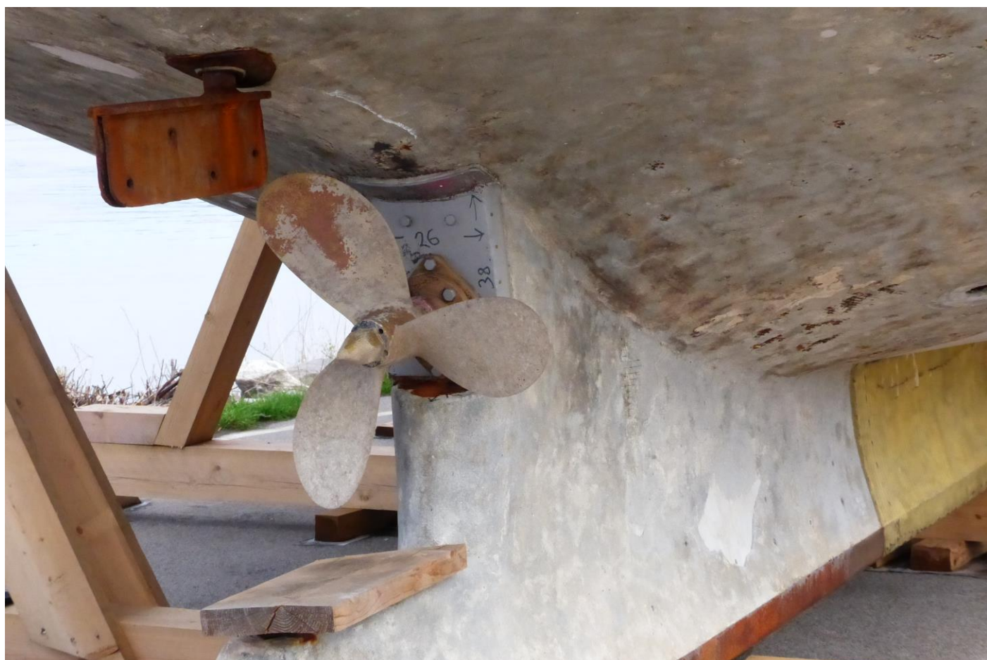
La suba parto. Videblas stirilo kaj helico. Aprilo 2023.