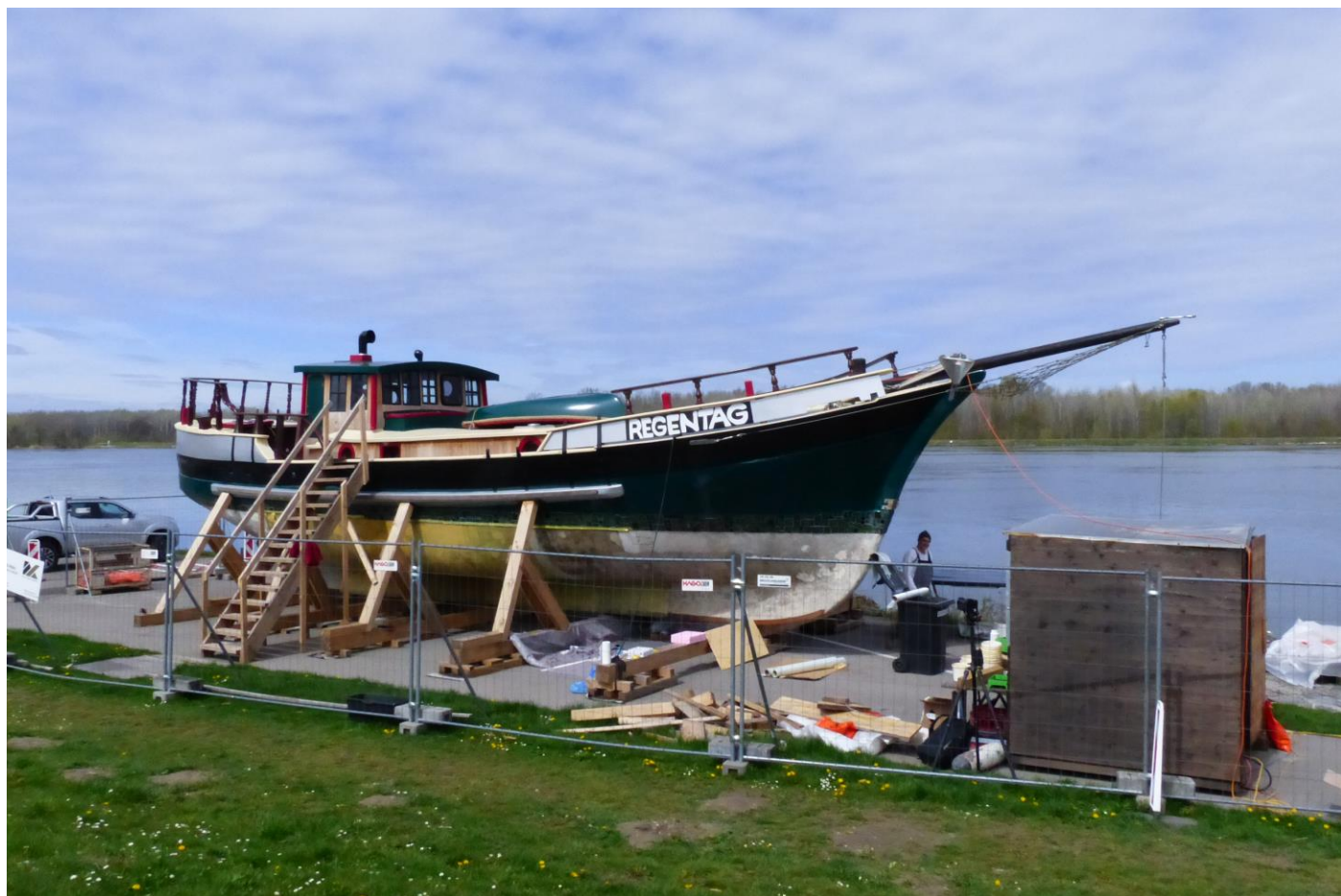
Dum la renovigado en marto 2023 en Tulno ĉe Danubo. Während der Renovierung im März 2023 in Tulln an der Donau.