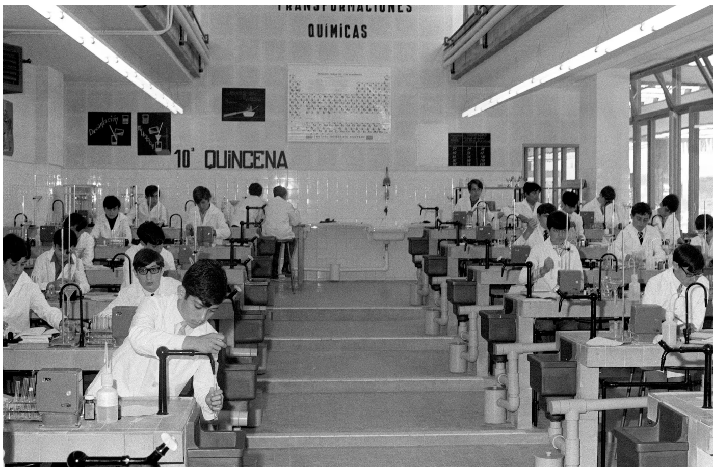
La Universidad Laboral de Xest en una imatge de la seva inauguració el 1970.

Però l'URSS en formigó de Xest és el colós brutalista de l'antiga Universitat Laboral. Només una dictadura podia alçar això: quatre mil obrers van treballar durant any i mig perquè en 1970 Franco inaugurés aquella superfície pavimentada que equival a 31 camps de futbol, amb un saló d'actes amb capacitat per a 5.300 espectadors. Fou una megalomania d'aires soviètics adscrita al Ministeri de Treball tardofranquista per facilitar estudis, cada any, a cinc mil alumnes de les classes més desfavorides que passaven el curs internats entre el fred del formigó i la llunyania familiar.