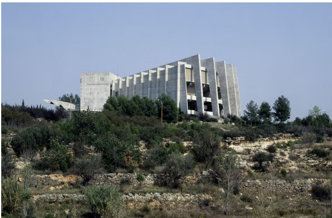
La Universitat Laboral de Xest.