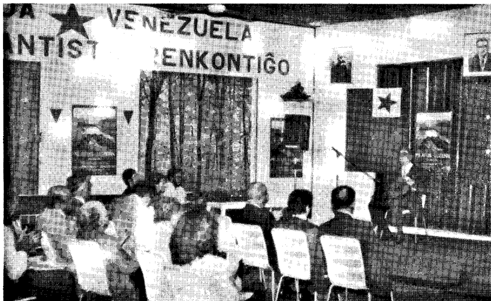
Prof. Antonio Lauro gitar koncertas dum la Unua Renkontiĝo de esperantistoj en Venezuelo.