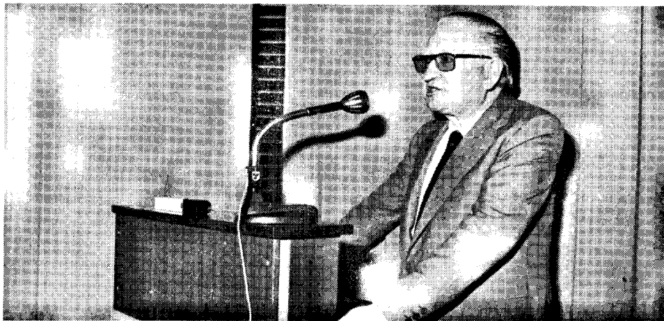
Nia forpasinta S-ano Molera prelegante.