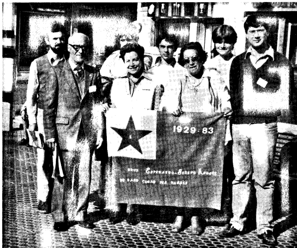
Grupo da partoprenantoj en la Kataluna Kongreso

OLOT de la 12-a ĝis la 14-a de Oktobro, 1984