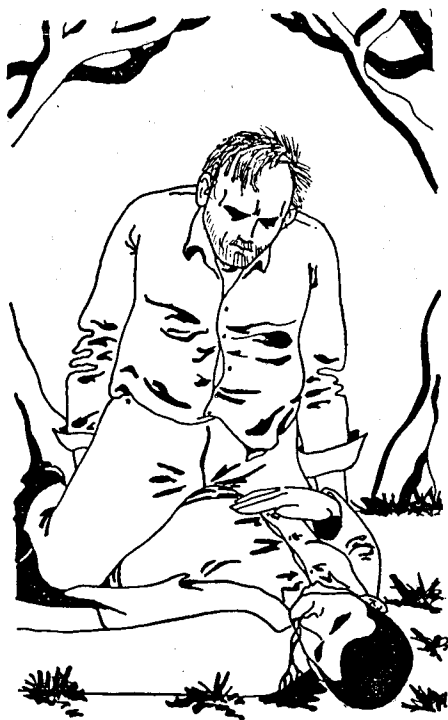
Ilustraĵo aperinta en «La Familio de Pascual Duarte».

beletra realismo hispana, kaj ankaŭ liaj stilo kaj manipulo de la lingvo tuj memorigas la manieron de Quevedo kaj ceteraj reprezentantoj de la pikareska ĝenro. Evidentas ankaŭ la influo de alia genia galego, Ramón María del Valle-Inclán, kies «Tirano Banderas» estas nesuperabla kulmino en la hispanlingva literaturo. Rilate al la tekniko kaj strukturo de