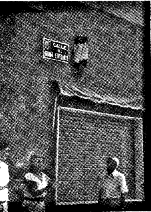
Inaŭguro de strato "Idioma Esperanto" en "Torre Pacheco"

peranto, ni devas kun renovigita entuziasmo kunlabori, laŭ niaj ebloj, en la projektoj de la nova HEF-estraro, ĉar (estante ĉiuj) unuigite ni povos atingi la deziratajn celojn.