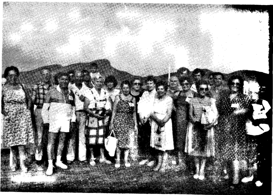
Kongresanoj en la antaŭkafeto de "El Club de Golf"

5) Danki al la aŭtoritatuloj de Kartageno, same kiel al la municipoj de La Unión, Torre-Pacheco kaj Los Alcáceres, pro ilia apogo donita al la Kongreso, kaj pro ilia respektiva dediĉo de strato kun la nomo Lingvo Esperanto.