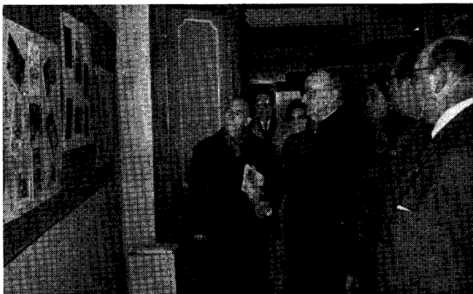
Lia Ĉefepiskopa Moŝto de Valladolid vizitas la Esperanto Ekspozicion

Ankaŭ en kunligo kun la festoj okaze de la Tago de Zamenhof, la Grupo "Fido kaj Espero" de Valladolid aranĝis de la 16-a ĝis la 30-a de Decembro 1968-a en grava ekspoziciejo de la urbo, internacian ekspozicion pri kristnaskaj bildkartoj presitaj aŭ skribitaj en la internacia lingvo. Oni montris al la vizitantoj pli ol 300 bildkartojn el 20 landoj i.a. estis reprezentantaj Sovetunio, Ĉeĥoslovakujo, Japanujo, Francujo, Bulgarujo, Finlando, k.t.p. kiujn ni ricevis plejparte speciale por la ekspozicio. La celo de la ekspozicio estis montri kiel pere de ununura lingvo kiel Esperanto ni povas interŝanĝi bondezirojn kun la tuta mondo. La inaŭguro okazis kun la ĉeesto de la Ĉefepiskopo de la urbo. Dum la tagoj de la ekspozicio oni informis amplekse ĉiujn vizitantojn kaj oni disdonis pli ol 3.000 hispanlingvajn informilojn pri Esperanto.