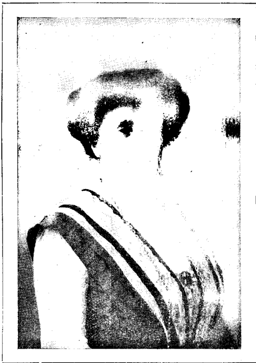
Sinjorino Klara de Zamenhof